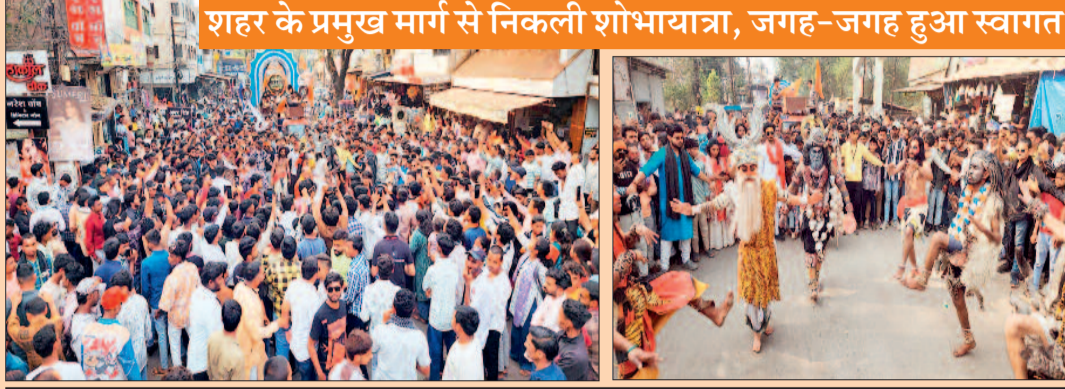
शहर के प्रमुख मार्ग से निकली शोभायात्रा, जगह-जगह हुआ स्वागत

शोभायात्रा में प्रमुख रूप से आकर्षण का केन्द्र महाकाल महादेव की भव्य झांकी रही। इसके अलावा नंदी बैल में विराजित महाकाल की भव्य प्रतिमा भी रही। बाजे-गाजे, धुमाल व डीजे के साथ-साथ दुलदुल घोड़ा, गुदुम बाजा, आदिवासी नृत्य, पंथी नृत्य एवं लोक कलाकारों की शानदान प्रस्तुति ने लोगों का मनमोह लिया। पूरे शोभायात्रा के दौरान अघोरियों का दल और उनकी प्रस्तुति ने लोगों को आकर्षित किया। शहर के प्रमुख मार्गों से निकली इस शोभायात्रा के दौरान भक्त शिव भक्ति में थिरकते रहे। भगवान महाकाल के जयकारों की गूंज रही।