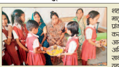
माता-पिता की पूजा के दौरान बच्चे और माता-पिता भावुक हो गए। कार्यक्रम में बच्चों के प्रति माता-पिता का अलग ही स्नेह दिखाई दिया। बच्चे भी भावुकता से माता-पिता से लिपट गए। वहीं माता-पिता ने भी बच्चों को खूब आशीर्वाद दिया।

शहर के गौरिनगर स्थित आदर्श विद्या संस्थान में 14 फरवरी को मातृ-पितृ पूजन दिवस मनाया गया। इस अवसर पर स्कूल प्रांगण में बच्चों ने अपने-अपने माता-पिता को तिलक लगाकर कर उनकी आरती उतारी और उनका आशीर्वाद लिया। इस आयोजन के लिए स्कूल द्वारा सभी बच्चों के माता-पिता और अभिभावकों को आमंत्रित किया गया था। बच्चों में स्कूली शिक्षा के साथ-साथ सेवा संस्कार की भावना जागृत करने के उद्देश्य से यह आयोजन किया गया। इस आयोजन में बच्चों द्वारा अपने माता-पिता की पूजा के दौरान बच्चे और माता-पिता भावुक हो गए। कार्यक्रम में बच्चों के प्रति माता-पिता का अलग ही स्नेह दिखाई दिया। बच्चे भी भावुकता से माता-पिता से लिपट गए। वहीं माता-पिता ने भी बच्चों को खूब आशीर्वाद दिया।